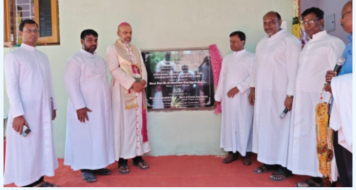
New Presbytery Blessing at Koneripatti