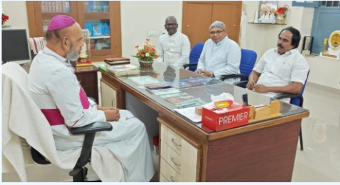
Minister Mano Thangaraj Meets Bishop Rayappan