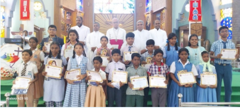
Catechism Inaugural Mass