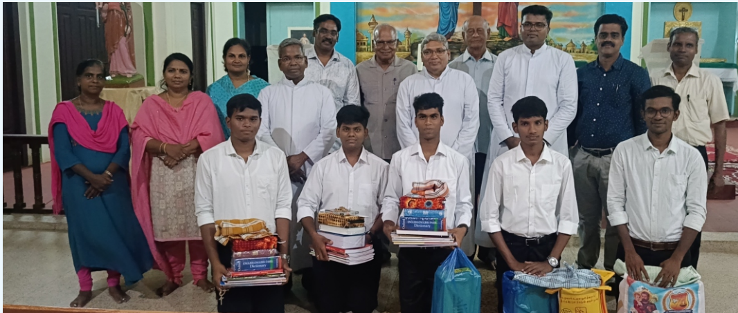
Serra Club invites the New Seminarians