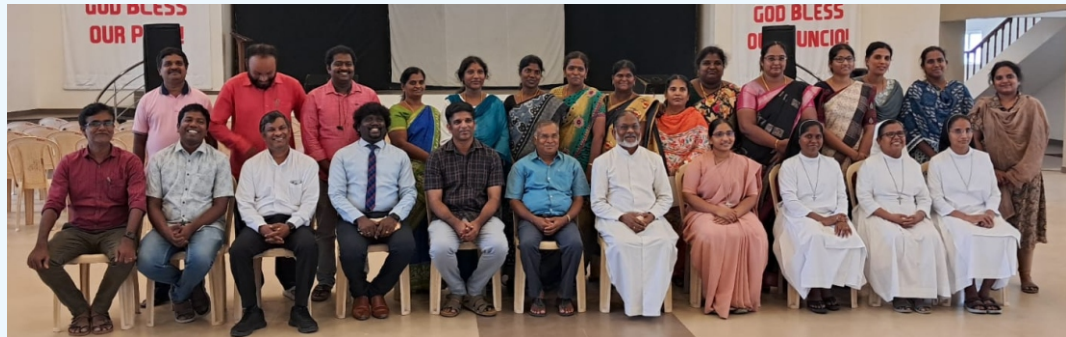
AI Workshop - Ephiphany Centre