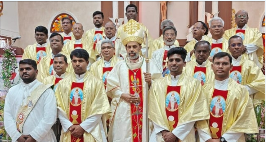
Fest Mass at Johnsonpet