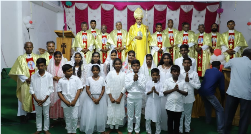
Fest Mass at Elachipalayam