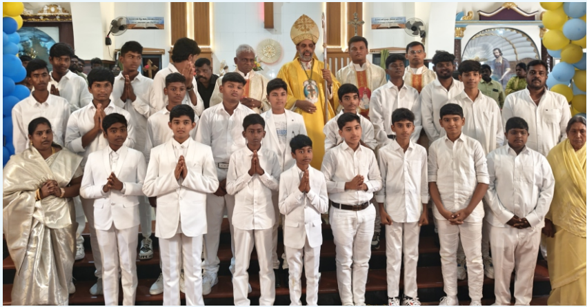
Confirmation at Shevapet