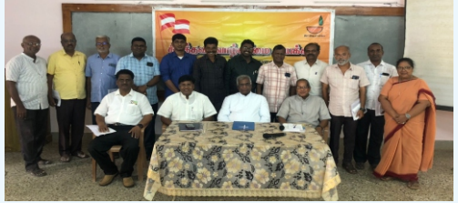
KVI Movement - Trichy